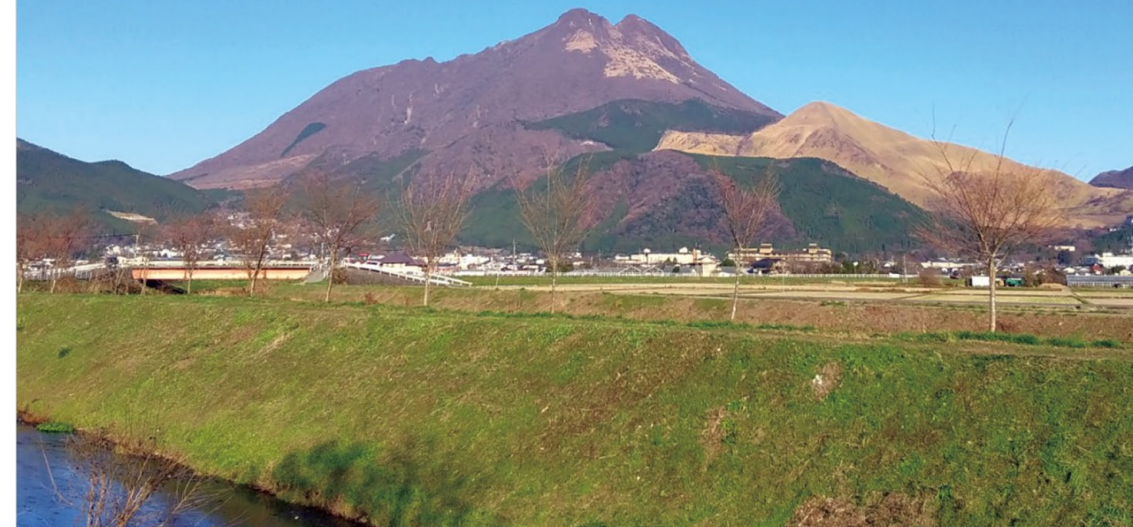
[南由布クリニックから望む由布岳]